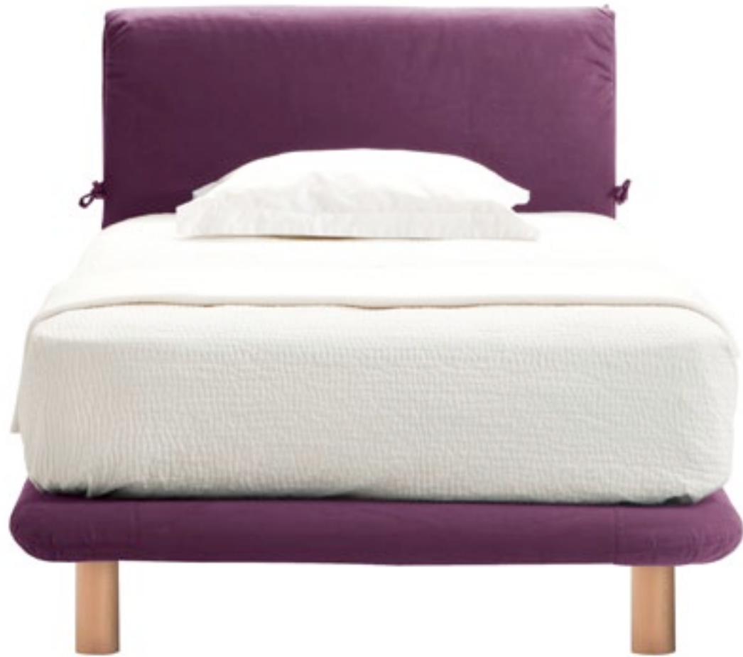
Tejido serie 1 color 109. Pata madera h 20cm