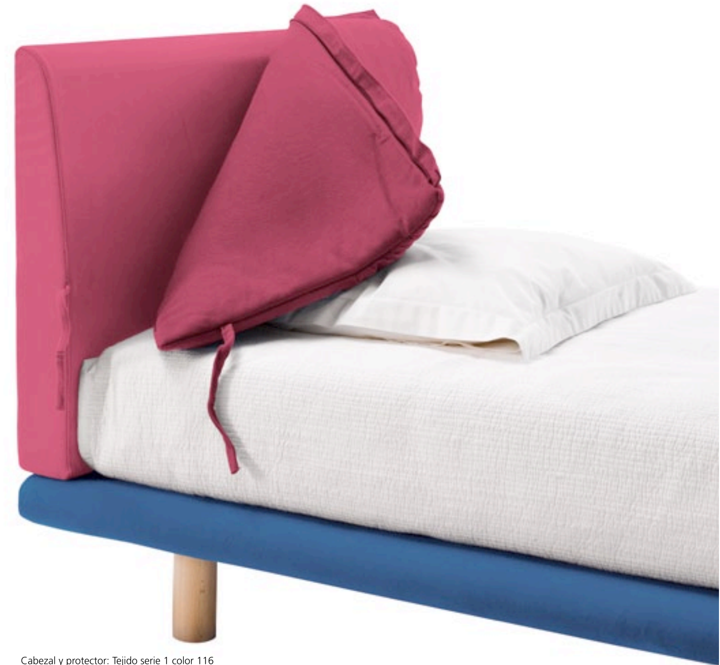
Cabezal y protector: Tejido serie 1 color 116 Plataforma: Tejido serie 1 color 103 Pata madera h 20cm

El colchón Berna con 25 cm. de altura, está especialmente pensado para la cama Rayas. Colchón joven, firme y cómodo a la vez por sus acolchados de Visco y su tejido suave que, además, está impregnado con microcápsulas de aroma que desprenderán un agradable olor a fresco y limpio por mucho tiempo. Más información en el catálogo Ecus Junior.